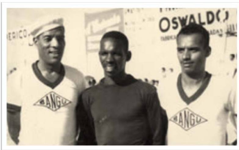
Domingos da Guia, Princesa e Nogueira – o “triângulo final” banguense que se apresentou em Fortaleza, em 1949.

Imagine um torcedor em 1949, antes da existência da televisão no Brasil. Naturalmente, seu maior companheiro para ficar sabendo de tudo o que acontece no mundo esportivo seria o rádio. Poderia comprar os jornais do dia seguinte e as revistas semanais para ver as fotos dos grandes ídolos. Mas, se não fosse ao estádio, não teria como vê-los realmente em ação.