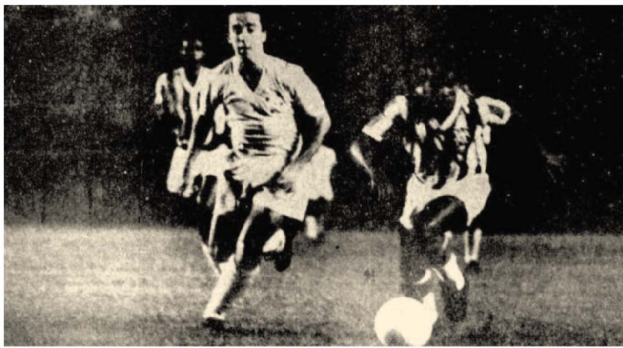
Fidélis com a bola, Tostão apenas olhando: uma surpreendente rotina no jogo entre os campeões carioca e brasileiro.

Em um torneio quadrangular com Cruzeiro, Atlético Mineiro, Palmeiras e Bangu, quem apostaria no título do Bangu? Atualmente, ninguém. Em 1967, provavelmente, seria um bom negócio. Em janeiro daquele ano, a Federação Mineira organizou o Torneio dos Campeões, reunindo o Cruzeiro (campeão mineiro e da Taça Brasil), o Palmeiras (campeão paulista), o Bangu (campeão carioca) e o Atlético, por ser o time que mais levaria público ao Mineirão.